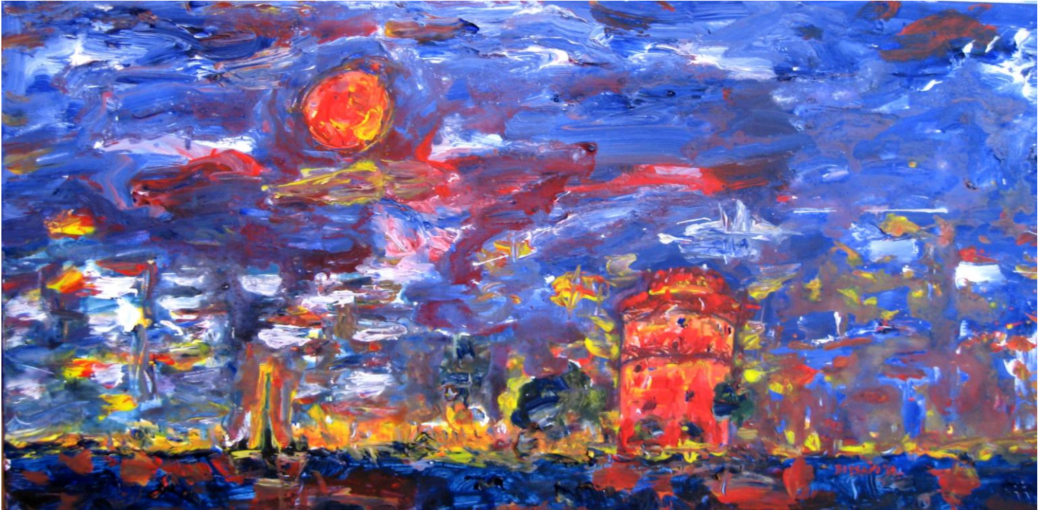
Τάσσα Μπιτσάνη, Τις Μαγικές σου Νύχτες Νοσταλγώ... , 2015