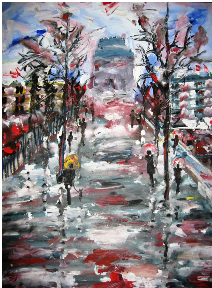
Τάσσα Μπιτσάνη, Ονειρική Θεσσαλονίκη, 2012

Ένα χάδι, μια αγκαλιά, αυτό χρειαζόταν μονάχα. Έτσι λοιπόν έφυγε ο σκυλάκος, κάτω από τον καταγάλανο ουρανό της Θεσσαλονίκης, δίπλα στον Λευκό Πύργο, ανάμεσα σε τόσο κόσμο. Βλέπετε λίγη αγάπη είναι αρκετή και ικανή να εξαγνίσει τις αθώες ψυχές. Μονάχα λίγη αγάπη.