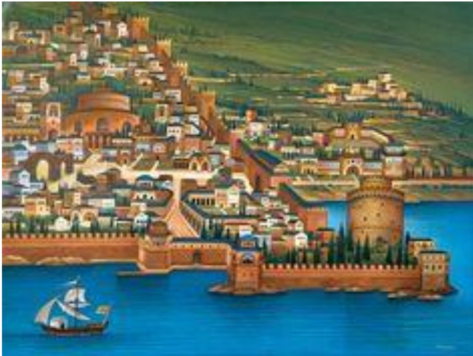
Θανάσης Μπακογιώργος, Βυζαντινή Θεσσαλονίκη, 1997

Πώς γίνεται αγάπες όπως αυτή να τελειώνουν;