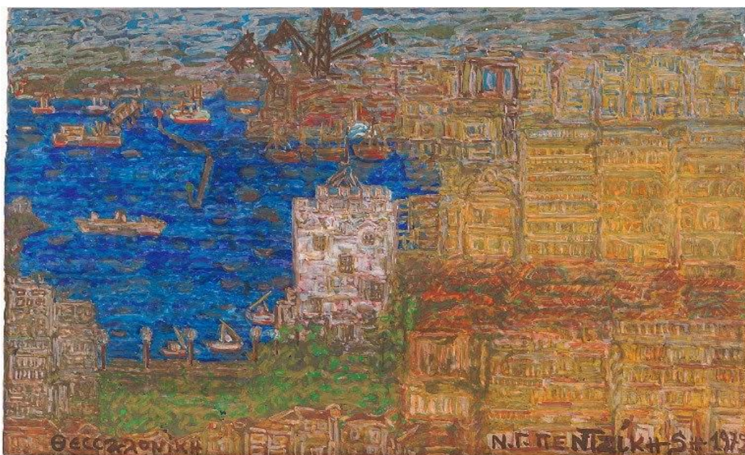
Νίκος-Γαβριήλ Πεντζίκης, Λευκός Πύργος, 1972