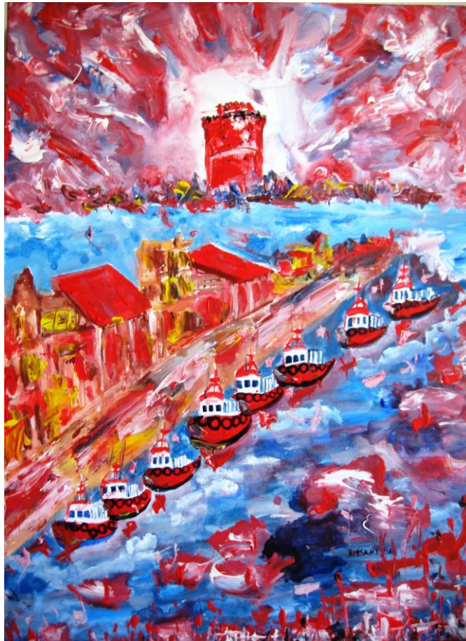
Τάσσα Μπιτσάνη, Χαρούμενες Υπάρξεις, 2016