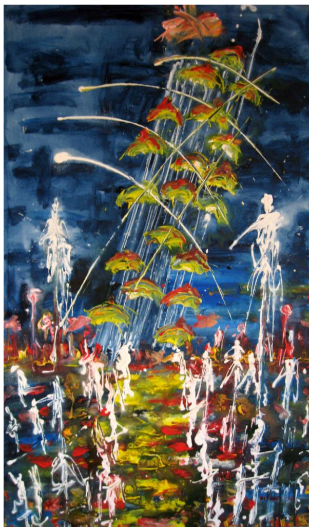
Τάσσα Μπιτσάνη, Ερωτική Θεσσαλονίκη, 2015

Μολυσμένη η ζωή, η δουλειά και η ιδέα, Πάνω απ' το στρώμα στέκει ο πόθος. Ο χτύπος αλλάζει, το τζάμι θα σπάσει, Το λουλούδι δεν φοβάται πως θα μαραθεί.