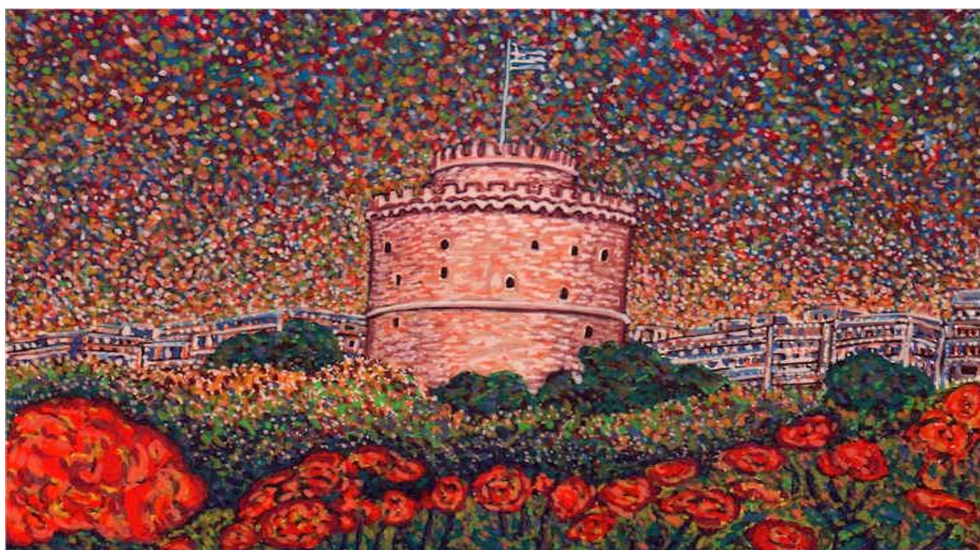
Ντίνος Παπασπύρου, "Άνοιξη στον Λευκό Πύργο" (Τέμπρα), 2015

ΗΜΕΡΟΜΗΝΙΑ ΔΙΑΓΩΝΙΣΜΟΥ 27 ΦΕΒΡΟΥΑΡΙΟΥ 2016 ΗΜΕΡΟΜΗΝΙΑ ΤΕΛΕΤΗΣ ΒΡΑΒΕΥΣΗΣ 4 ΑΠΡΙΛΙΟΥ 2016