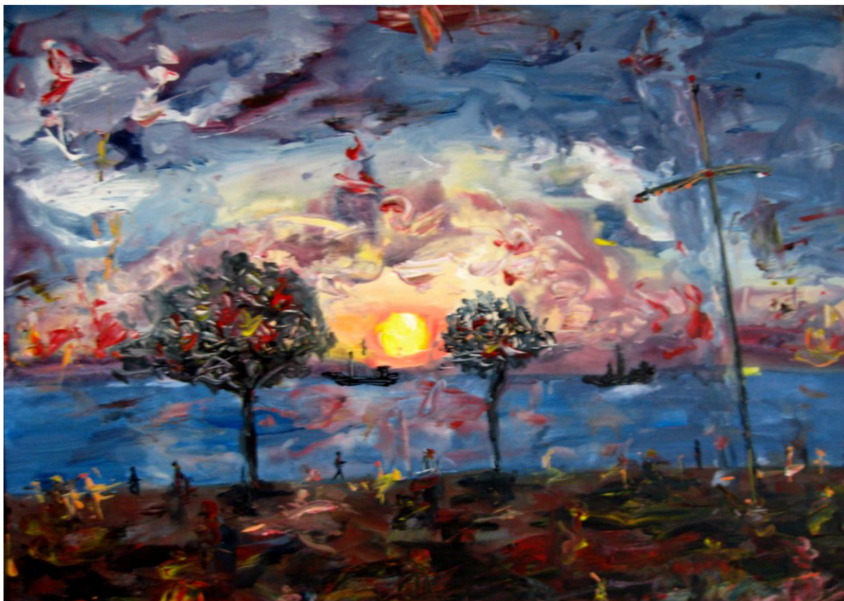
Τάσσα Μπιτσάνη, Ηλιοβασίλεμα που μας ζεσταίνει την καρδιά, 2015